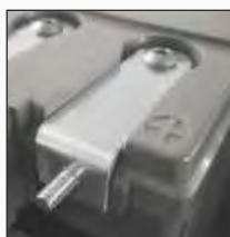
Вариант В: охватываемый переходник M6 контактов с фронтальным выводом