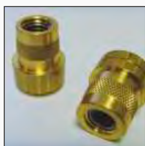
Vaihtoehto A: SAE-napa