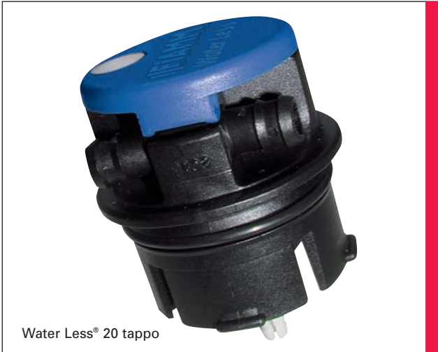
Water Less® 20 tappo