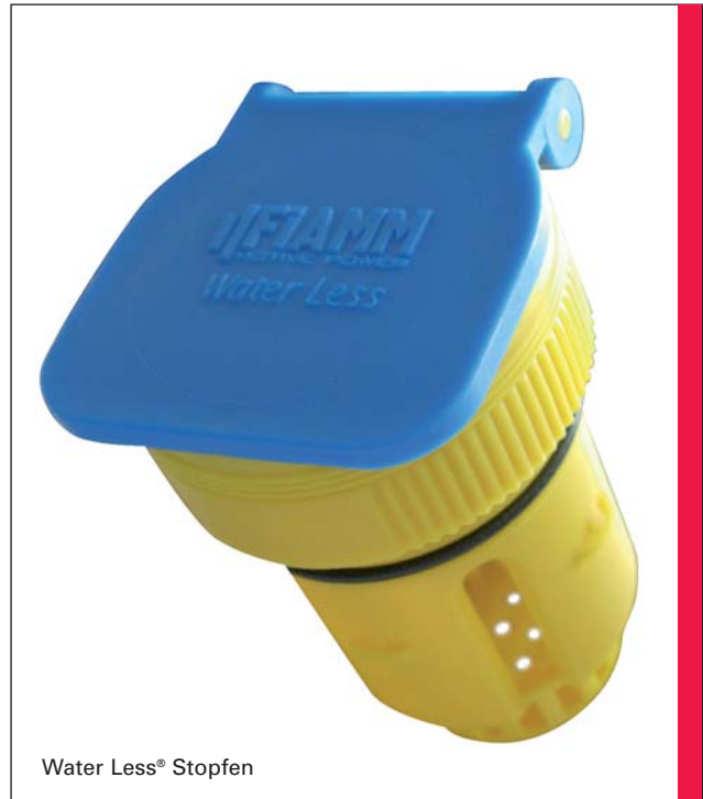
Water Less® Stopfen

Alle Fiamm Motive Power Water Less® Zellen basieren auf der bewährten PzS-Technologie. Die positiven Elektroden sind als Panzerplatte (PzS) ausgeführt, bei deren Herstellung modernste Komponenten eingesetzt werden, um eine noch höhere Wirtschaftlichkeit zu erzielen. Die negativen Platten sind als Gitterplatte ausgeführt. Als Separator werden mikroporöse Scheider verwendet. Konstruktive Merkmale wie eine größere Elektrolytkapazität, eine niedrigere Prismenhöhe und neuartige Klappdeckelstopfen stellen einen weiteren Mehrwert für unsere Kunden dar. Fiamm Motive Power Water Less – weniger ist mehr. Seltener nachfüllen – Mehr Vorteile.