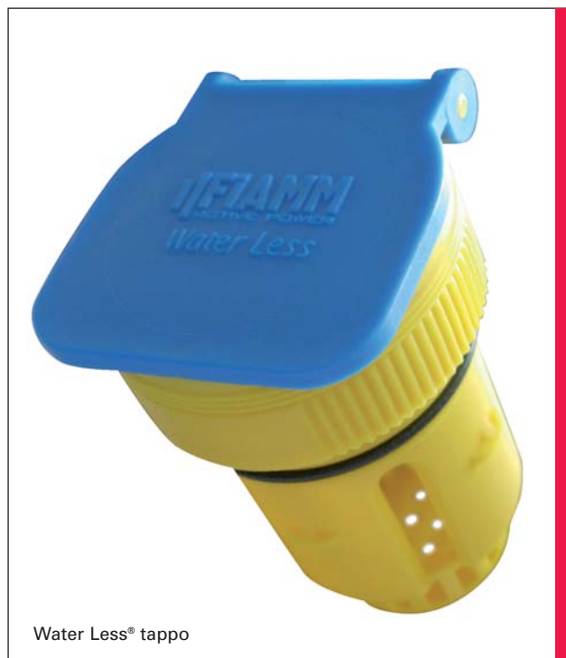
Water Less® tappo

Tutte le celle Water Less® usano la comprovata tecnologia PzS. L’elettrodo positivo è costituito da piastre tubolari presso fuse e l’utilizzo di componenti avanzati nella produzione ne aumenta l’efficienza. L’elettrodo negativo è composto da piastre piane con massa attiva spalmata. Il separatore è di tipo microporoso. Le specifiche tecniche implementate come la maggiore capacità volumetrica di elettrolito, una ridotta altezza dei prismi e nuovi tappi manuali, assicurano il valore aggiunto della bassa manutenzione che è una delle esigenze maggiori nelle applicazioni trazione. Fiamm Motive Power Water Less® – Minori tempi di manutenzione si traducono in maggiori benefici per il cliente.